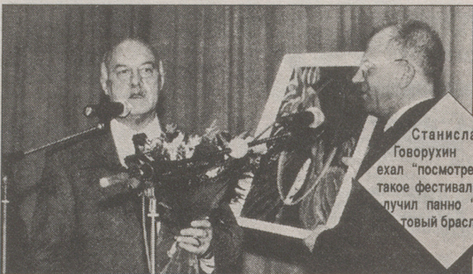
Станислав Говорухин: "Приехал посмотреть, что такое фестиваль" и получил панно "Гранатовый браслет"