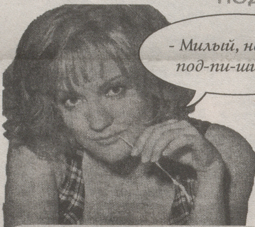
- Милый, не грехи, под-пи-шись!

Напоминаем, что оформить подписку на "Гатчина-ИНФО" можно в любом почтовом отделении города и района. Стоимость подписки на месяц для абонентов кабельного телевидения - 850 рублей, для всех остальных - 1500 рублей. НЕ ГРЕХ И ПОДПИСАТЬСЯ!