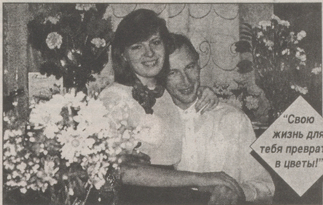
"Свою жизнь для тебя преврати в цветы!"

Организационное собрание состоится 12 и 17 марта в 16 часов в Школе творческого развития по адресу: пр.25 Октября, 18, телефон для справок: 3-65-43.