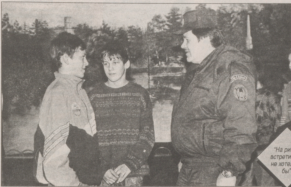
"На ринге встретиться не хотелось бы"